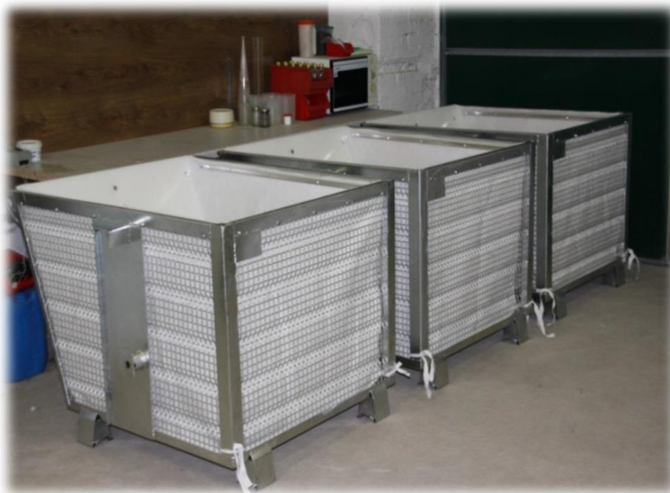
Übersicht / Overview

Ausführung in massiver Schweißkonstruktion, ohne bewegliche Teile, deshalb besonders robust und speziell auch für rauen Betrieb geeignet, Material Stahl, feuerverzinkt, Seitenteile und Boden in massiver Stahlgitterausführung, ausgelegt mit gitterverstärktem Spezialfiltervlies, Schüttwand glatt, gepanzert, oben offen